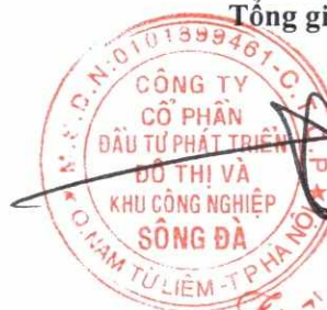
Trần Việt Dũng