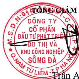
Trần Việt Dũng